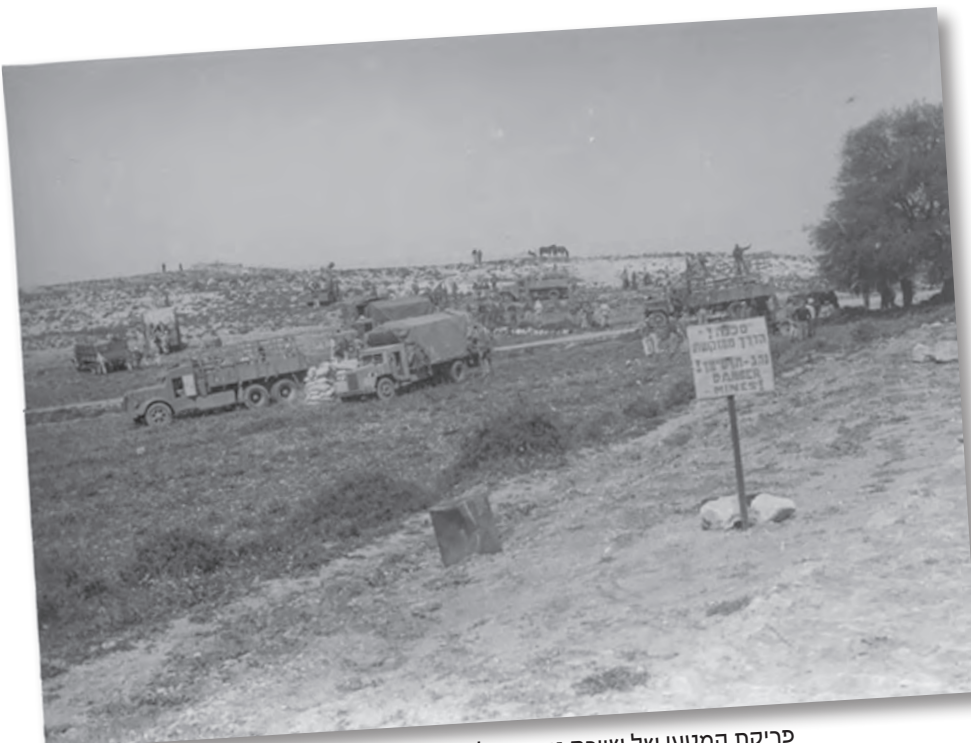
פריקת המטען של שיירת נבי דניאל על יד "האלון הבודד"

השיירה החוזרת נתקלה במחסומים שהניחו אנשי הכנופיות סמוך לאתר "נבי-דניאל" ונעצרה (בין נווה דניאל לצומת אפרת צפון של היום), כשהיא מותקפת על-ידי המוני פורעים ערבים מהרכסים סביב.