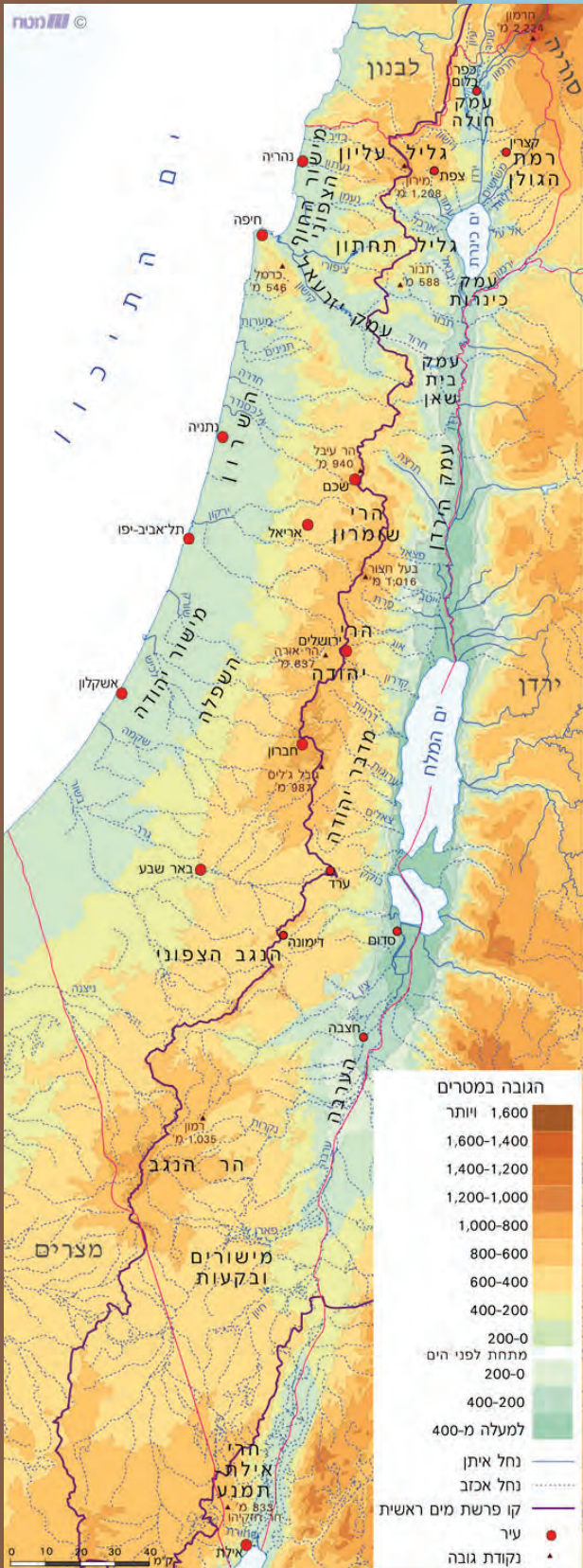
כרטוגרפיה: סופר מיפוי © מעתח המרכזי לטכנולוגיה חינוכית

הקו הדמיוני נמתח מגבול סיני בסביבות הר רמון, לאורך שדרת ההר המרכזית- יהודה, בנימין והרי השומרון. בצפון עובר הקו בהרי נצרת, הר מירון עד בָּרְעַם בגבול לבנון.