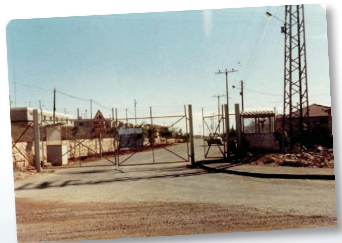
תמונות ארכיון אלון שבות