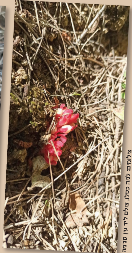
צולם ליד עין סגימה